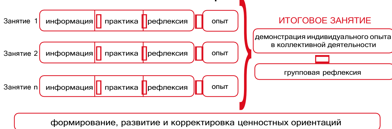
Рисунок 1 — Схема организации события

Таким образом, у пятиклассников происходит построение логической цепочки от собственного опыта проживания каждого занятия к ознакомлению с опытом других детей и к формированию общего отношения классного коллектива к прожитому ими событию.