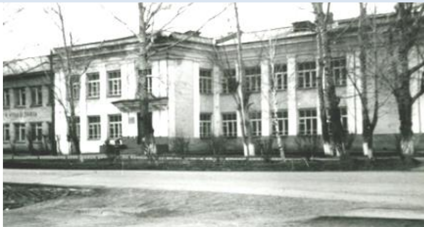
Ул. Транспортная, ныне СОШ № 14