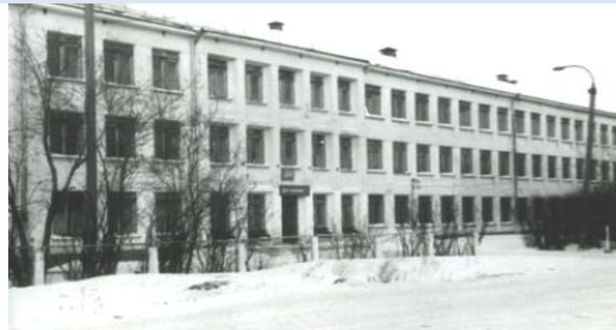
Здание начальной школы № 85 ул. Шевченко 1