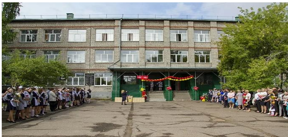
Здание старшей школы № 85