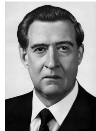
Долгих Владимир Иванович 1924-2020 гг.