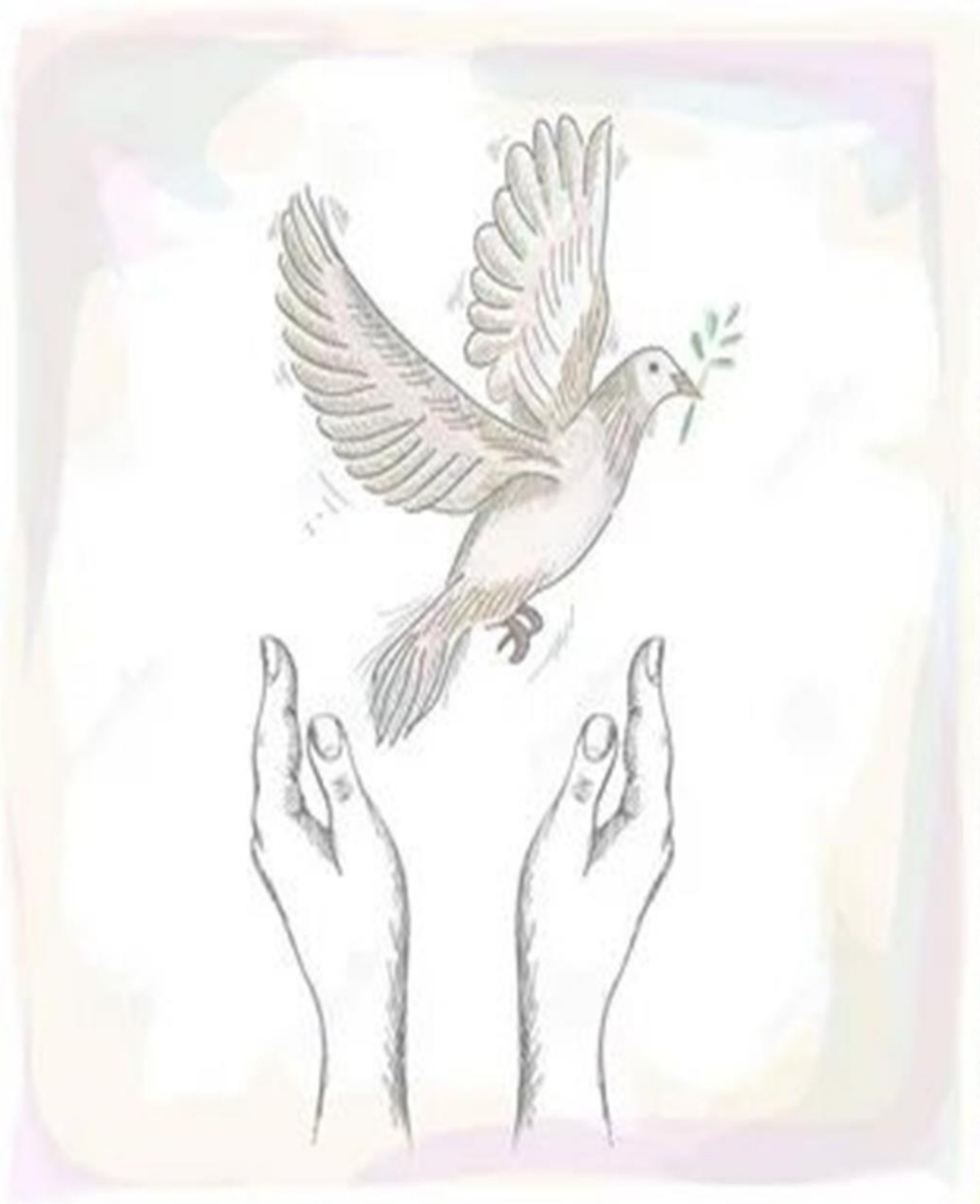
Художник Силина Виктория